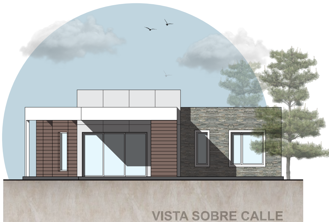
VISTA SOBRE CALLE

CUBIERTOS 103,95m 2 | SEMI CUBIERTOS 50,30m 2