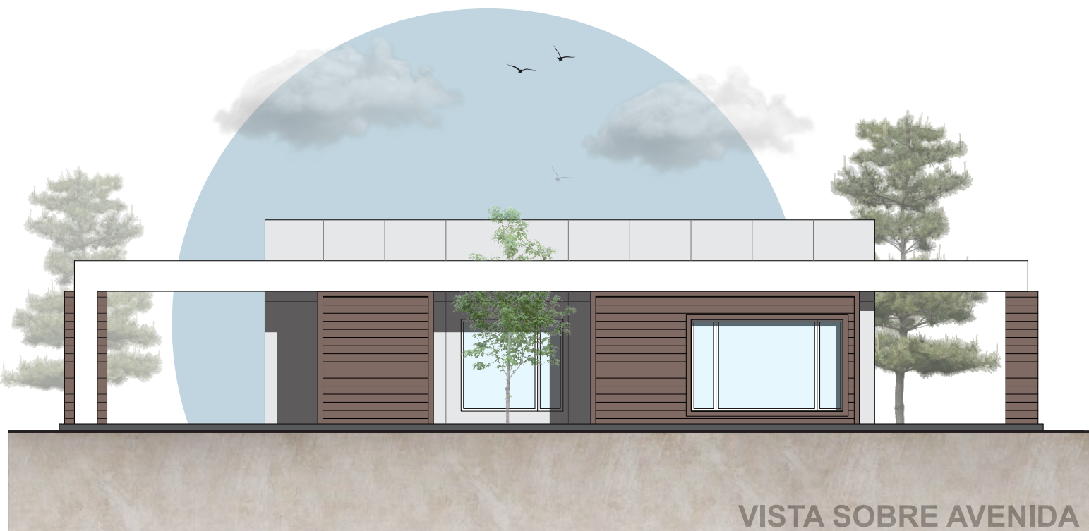
VISTA SOBRE AVENIDA